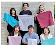
クラシコ株式会社 サステナビリティプロジェクトチーム (白衣・スクラブの残布の提供と縫製)