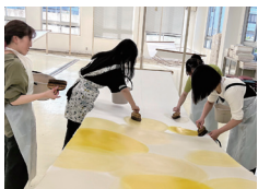
大手前大学 建築&芸術学部 今福ゼミ (植物染料を用いた染色)