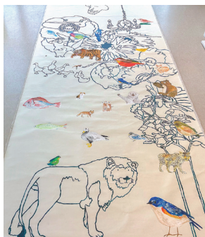
池平 徹兵 「想いの形」2024年 キャンバス、アクリル絵の具、水彩、紙