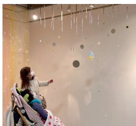
5 SENSES+ 「くろきの音色」2024年 ミクストメディア