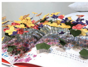
たかはし しな 「Blooming Flower Garden」2024年 布、ペン、ワイヤー