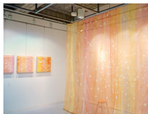
いまぶく ふみよ 「色の中の色」2023年 綿、シルクオーガンジー、植物染料