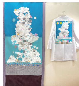
ヒガシテツペイ 「可能性の扉」2024年 白衣・スクラブの残布、絵の具