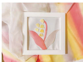
Reyca 「花灯」2024年 布、植物染料を用いた染色 (今福ゼミ作)