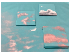
いし まゆみ 「みんなのSORAIRO (空色)」2024年 スクラブの残布、布絵の具、紙ボード