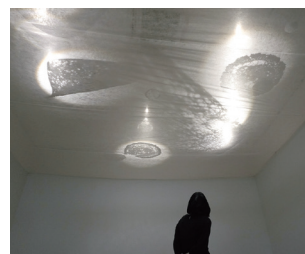
葛本 康彰 「底、みあげたおとしもの / what can we see from there?」2022年 ミクストメディア