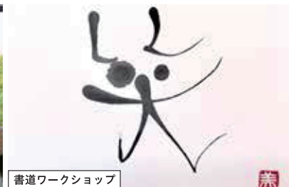
書道ワークショップ