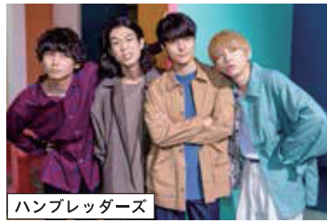
ハンブレッダーズ