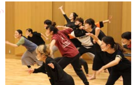
令和2年度 創造のコース稽古風景